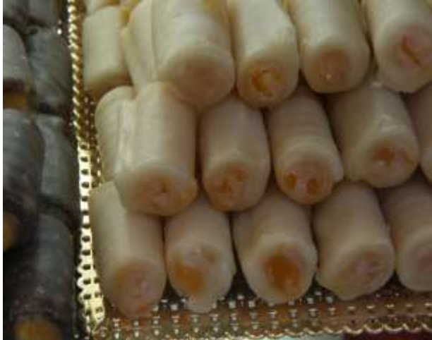
Huesos de santo

Durante las fechas próximas al Día de Todos los Santos es habitual encontrar en las pastelerías algunos dulces típicos: huesos de santo, buñuelos y panellets en la zona del Mediterráneo.